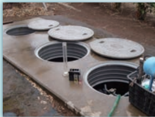
一般家庭(小型合併浄化槽)

浄化槽は、微生物などの働きを利用して水をきれいにします。きちんと管理しなければ機能が低下し、本来の機能を十分に発揮できず水質が悪化したり、悪臭や機器類故障にもつながります。