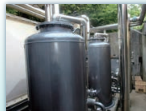
ろ過器点検・修理