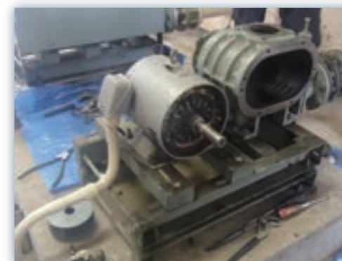
ブローオーバーホール